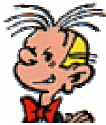
Fantasio reporter et secrétaire de rédaction

Pilier de la rédaction jusqu'à la planche 480 du 8ème album, il doit subir les inventions de Gaston et les péripéties qui en découlent. Prunelle le remplace comme interlocuteur de De Mesmaeker (sans succès) planche 481 et comme responsable du travail (?) de Gaston à partir de la planche suivante. Fantasio réapparaît pour un gag pl.517 (9).