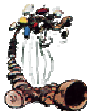
Le brontosaurophone ou gaffophone