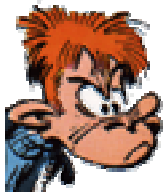
Jo motard copain de Gaston

Amoureuse de Gaston, elle lui voue une admiration de tout instant. Les relations restent cependant platoniques. Mais lorsque Gaston l'embrasse sur la joue pl.699 (13), la réaction de Jeanne est inattendue ! Gaston va jusqu'à emprunter la grande échelle des pompiers pour lui rendre visite pl. 372 (6). Jeanne a aussi peur des souris et Gaston élève des rongeurs.