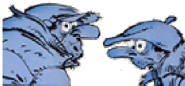
Freddy-les-doigts-de-fée et Cloclo-

Pilier de la rédaction jusqu'à la planche 480 du 8ème album, il doit subir les inventions de Gaston et les péripéties qui en découlent. Prunelle le remplace comme interlocuteur de De Mesmaeker (sans succès) planche 481 et comme responsable du travail (?) de Gaston à partir de la planche suivante. Fantasio réapparaît pour un gag pl.517 (9).