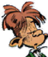
Jules-de-chez-Smith- en-face copain de Gaston