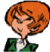
Mlle ? secrétaire de De Mesmaeker

n'apparaît qu'une seule fois. Qui connaît son prénom ?